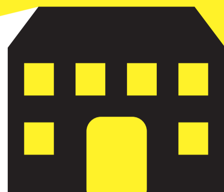
TEATRO ROSCIATE SCANZOROSCIATE