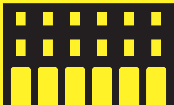
CINETEATRO SAN SISTO DI COGNOLA