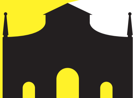
SALA DI PORTA SANT'AGOSTINO