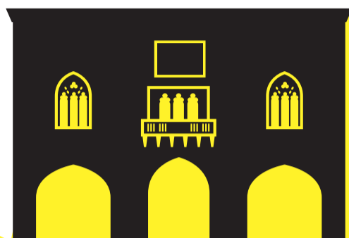
PALAZZO DELLA RAGIONE