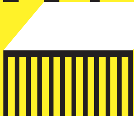
AUDITORIUM DI PIAZZA DELLA LIBERTÀ