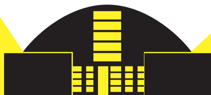
CENTRO POLIVALENTE DI BRUSAPORTO